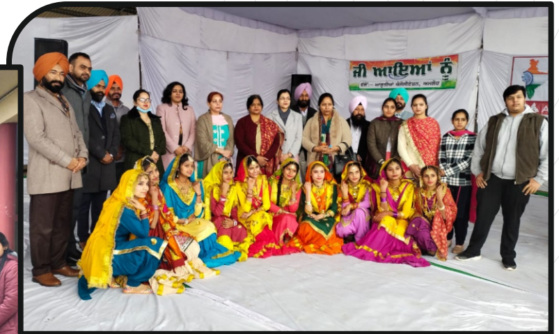
Republic Day - 2022