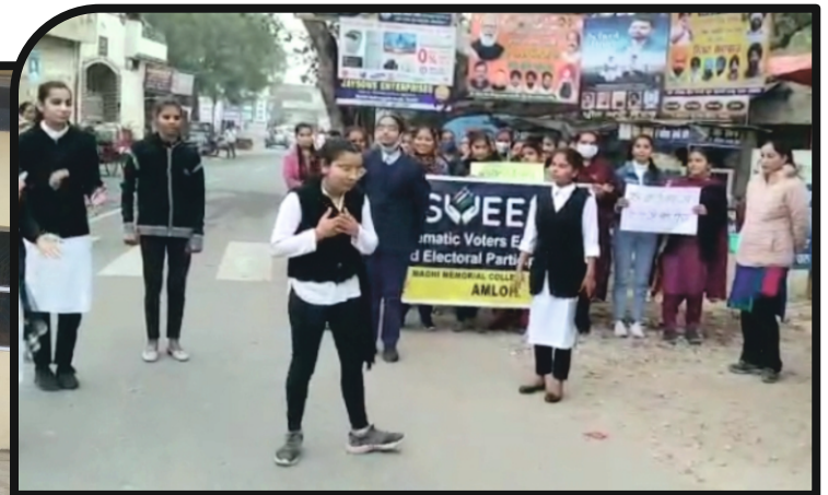
Sveep Activities - 2022