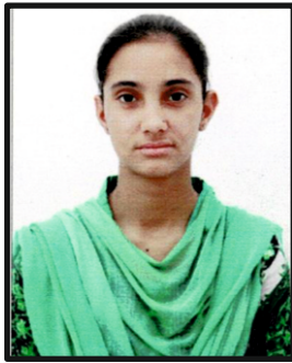
AASHIA B.A. 91.80%