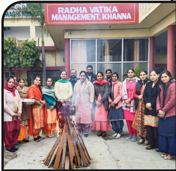
Lohri Celebration - 2022