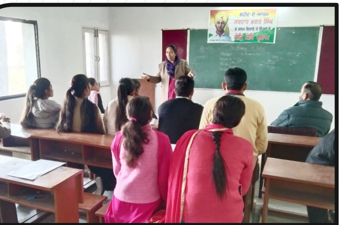
Orientation Programme - 2022